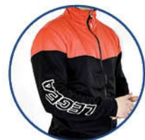
LOGO STAMPATO SU MANICA