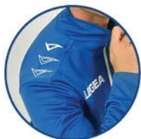
LOGO LEGEA VELE RIPETUTO SU SPALLA